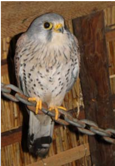
27 december 2014