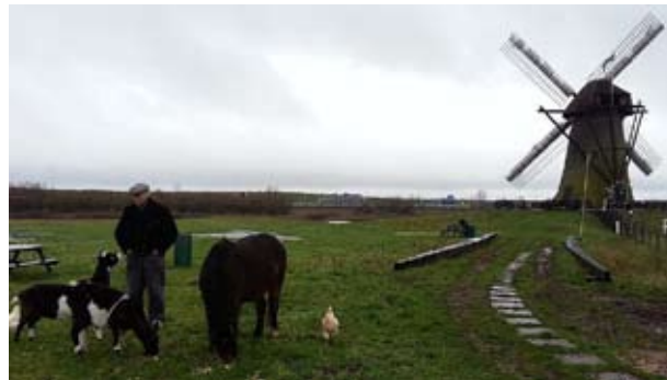
17 december 2014